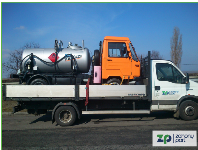
Megérkezett a Multicar üzemanyagszállító Eperjeskére